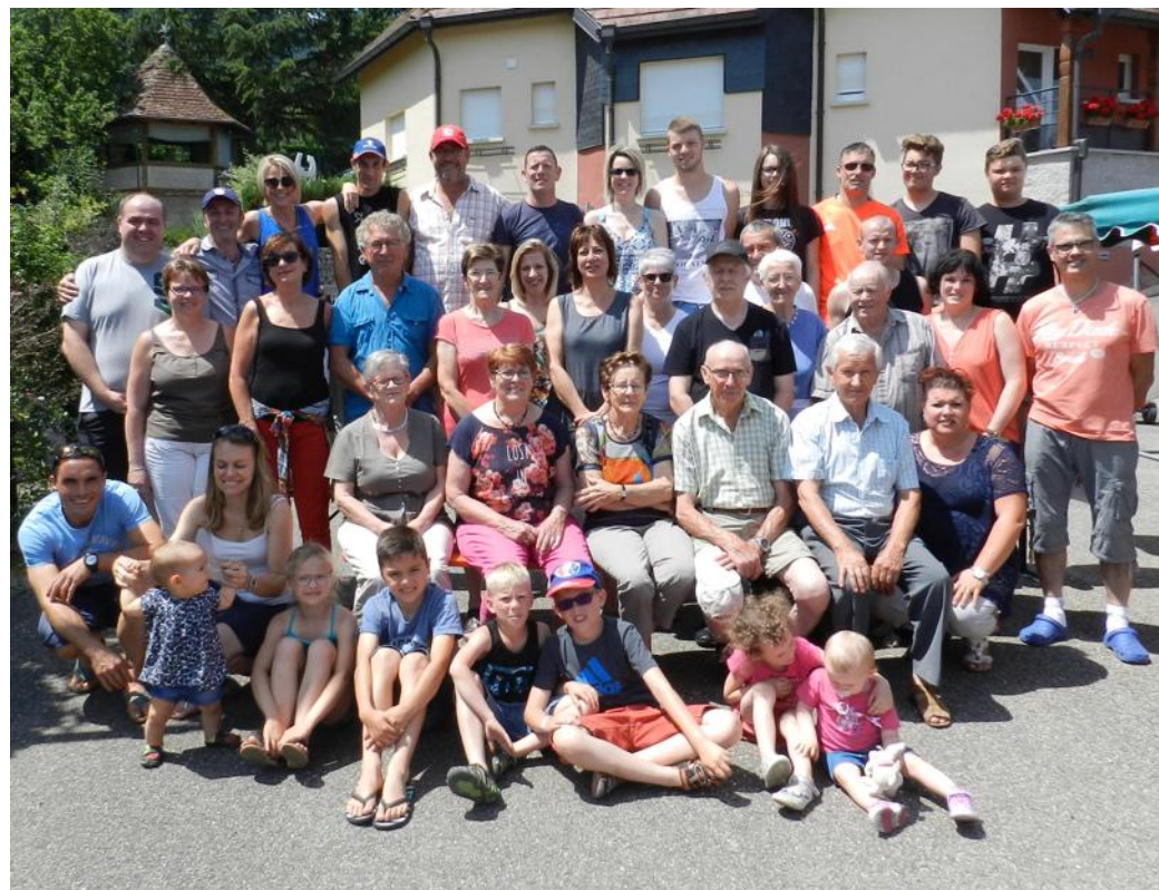
Les participants de la cinquième fête du quartier du Faubourg.

Dans le quartier du Faubourg de Dieffenbach-au-Val, une bonne trentaine de personnes, et majoritairement des jeunes, ont vécu la journée annuelle des retrouvailles dernièrement.